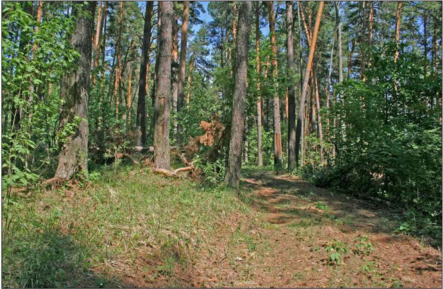
Игимский бор в Мензелинском районе